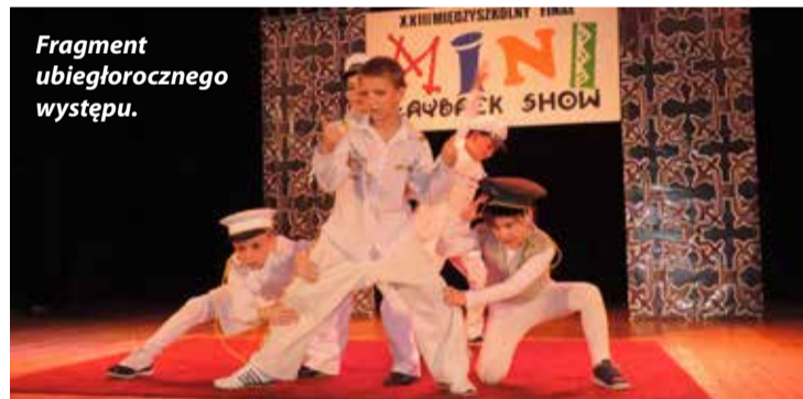
Fragment ubiegłorocznego występu.

We wtorek, 19 maja 2015 r. o godz. 16.00 w sali widowiskowej Bogatyńskiego Ośrodka Kultury odbędzie się XXIV Finał „Mini Playback Show”.