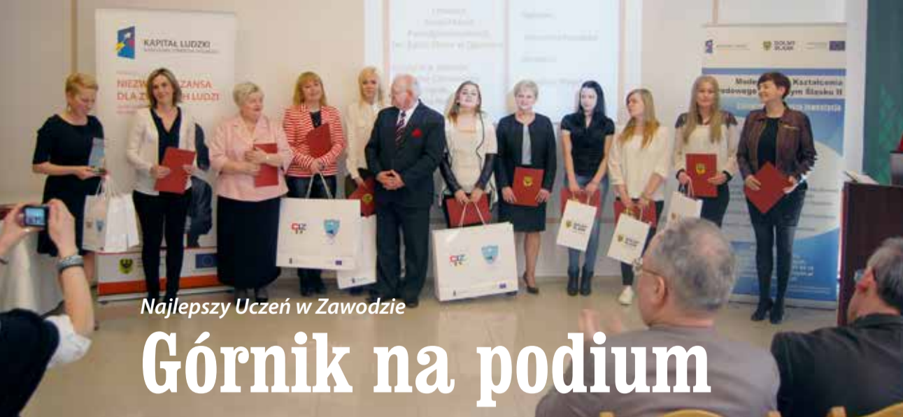
Najlepsi Uczniowie w Zawodzie