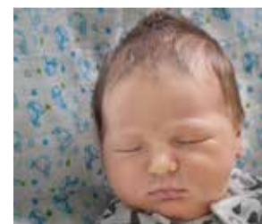
Miłosz Figura 30 marca 2015