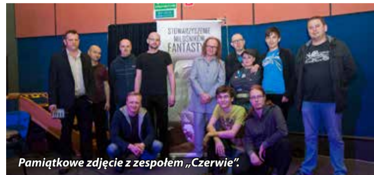
Pamiątkowe zdjęcie z zespołem „Czerwie”.

deon i syntezatory. Premiero- we wykonanie muzyki do „Metropolis” zostało bardzo entuzjastycznie przyjęte przez bogatyńską publiczność. Połączenie obrazu i dźwięku sprawiło, że sala kinowa zamieniła się w niesamowite miejsce, gdzie rozbrzmiewająca muzyka przeniosła widzów do miasta Metropolis. Zapraszamy na kolejne muzyczno-filmowe wydarzenia do Kina KADR 3D!