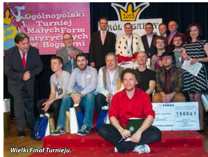
Wielki Finał Turnieju.

być najnowszą książkę wraz z autografem i dedykacją autorki. 32. Turniej Małych Form Satyrycznych już za nami. Bogatynia kolejny raz stała się polską stolicą uśmiechu i dobrego humoru. Kolejne emocje już za rok. Serdecznie i gorąco gratulujemy wszystkim laureatom i już dziś zapraszamy na 33. Turniej Małych Form Satyrycznych!