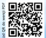
Kod QR do wersji PDF